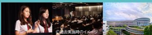
過去実施時のイメージ

アジアトップレベルのシンガポール国立南洋理工大学を舞台に、科学・社会科学をテーマにしたグローバルな成果発表コンテスト！共通の興味関心を持つ各国の同世代に向けて、自身の研究内容を英語で発表・議論・交流が出来る課題研究・探究の世界大会です。